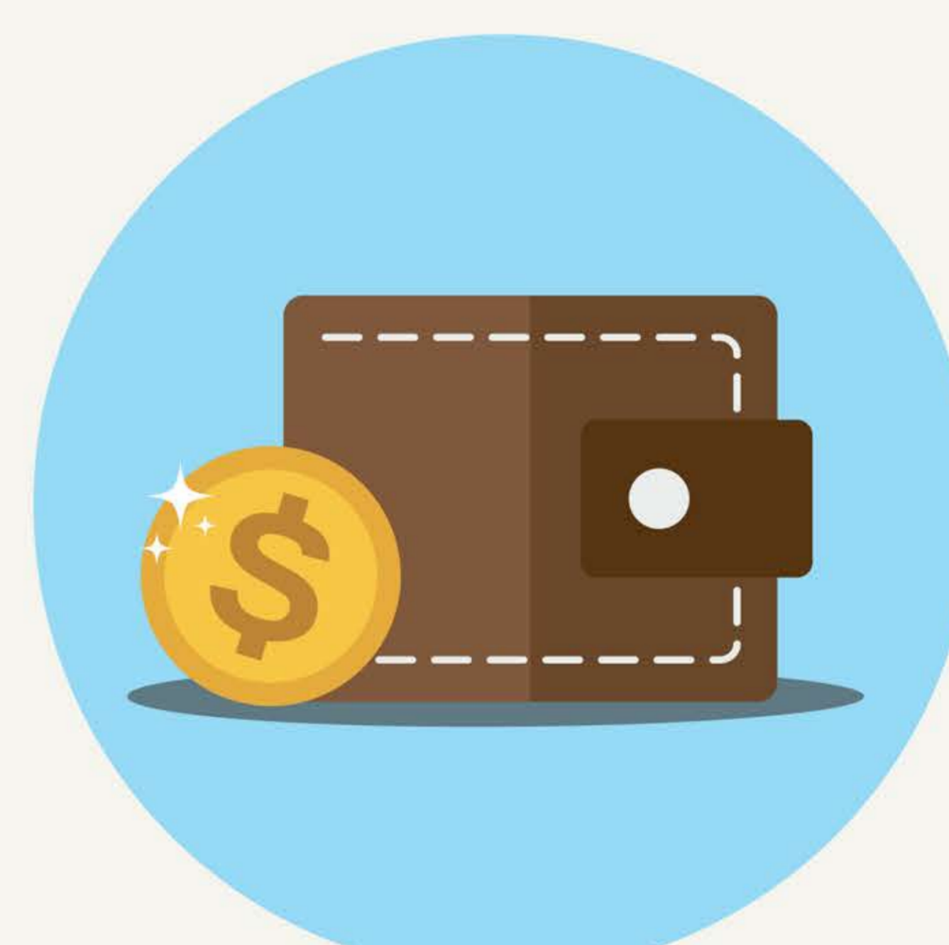
Olcsóbb a működtetésük.