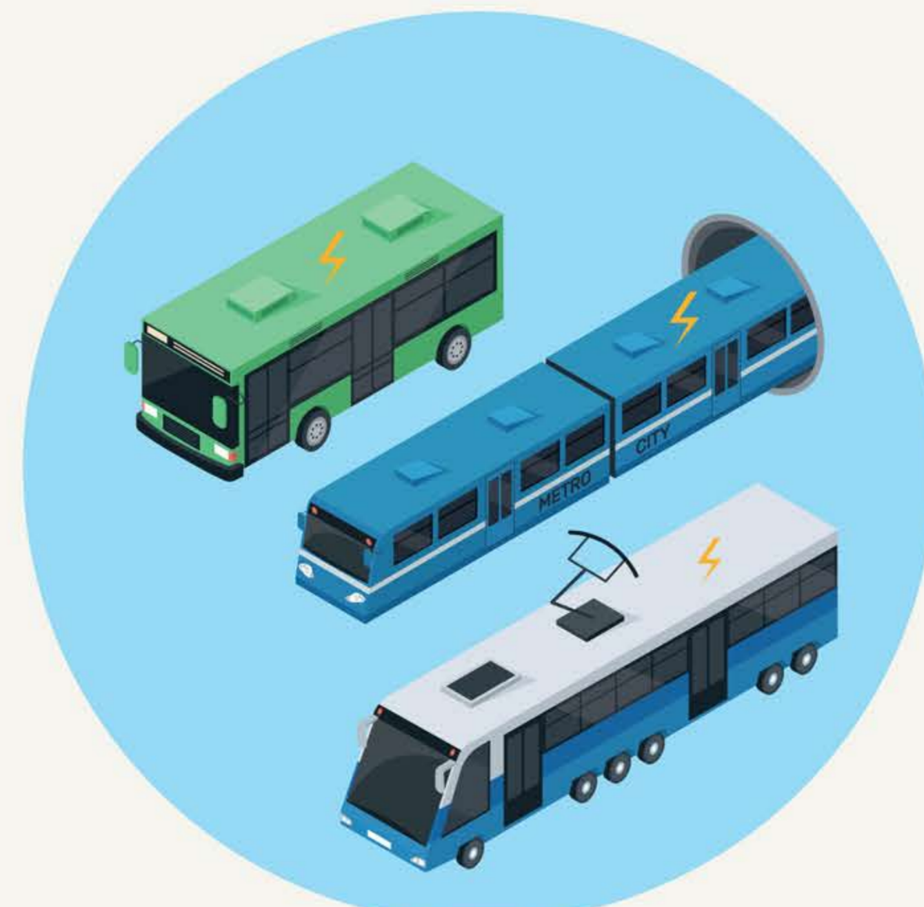
Elektromos tömegközlekedési eszközök: trolis, vonat, villamos, elektromos busz.