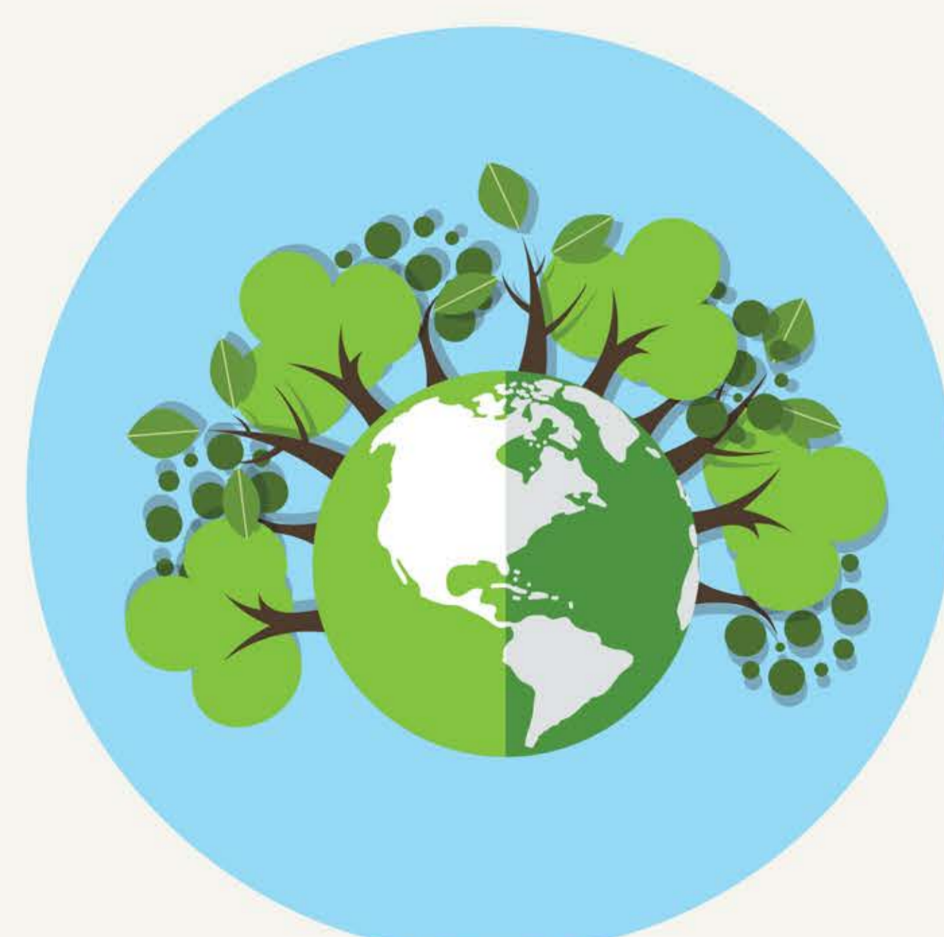
Kevésbé szennyezik a levegőt.